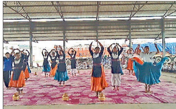
नारायणगढ़। रिहर्सल के दौरान सांस्कृतिक कार्यक्रम प्रस्तुत करते हुए बच्चे।

समारोह में प्रस्तुत किए जाने वाले सभी कार्यक्रमों जिनमें सांस्कृतिक कार्यक्रम एवं मार्च पास्ट/परेड की रिहर्सल 12 अगस्त को 9 बजे अतिरिक्त अनाज मंडी में