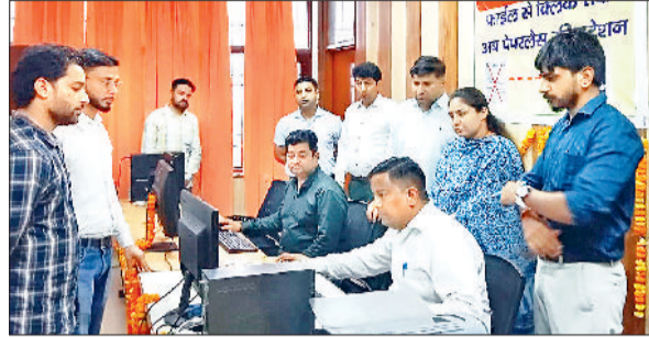
नारायणगढ़। एसडीएम तहसील में स्थापित कंप्यूटर रूम का अवलोकन करते हुए।

भूमि रजिस्ट्री की प्रक्रिया के डिजिटलीकरण से लोगों को सुविधा होगी, समय और कामगो कार्रवाई की बचत होगी