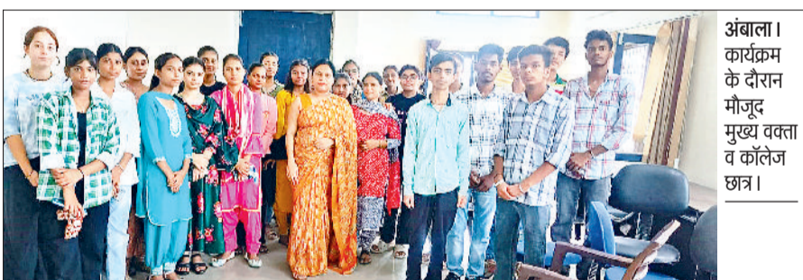
अंबाला। कार्यक्रम के दौरान मौजूद मुख्य वक्ता व कॉलेज छात्र।

इस प्रशिक्षण कार्यक्रम का उद्देश्य विद्यार्थियों और पुस्तकालय उपयोगकर्ताओं को नेशनल डिजिटल लाइब्रेरी ऑफ इंडिया के