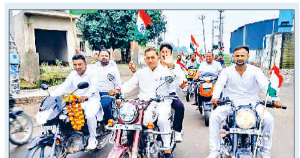
शहजदपुर। पूर्व विधायक के नेतृत्व में तिरंगा यात्रा निकालते हुए भाजपा कार्यकर्ता और ग्रामीण।