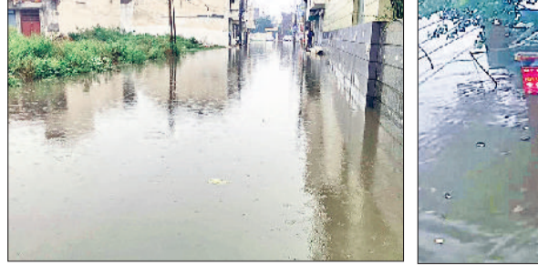
यमुनानगर। बारिश होने से नीचले इलाकों व सड़कों पर भरे पानी के बीच से गुजरते वाहन।

बारिश के पानी की निकासी के दावे हो रहे फेल, जगह जगह जमा हुआ पानी