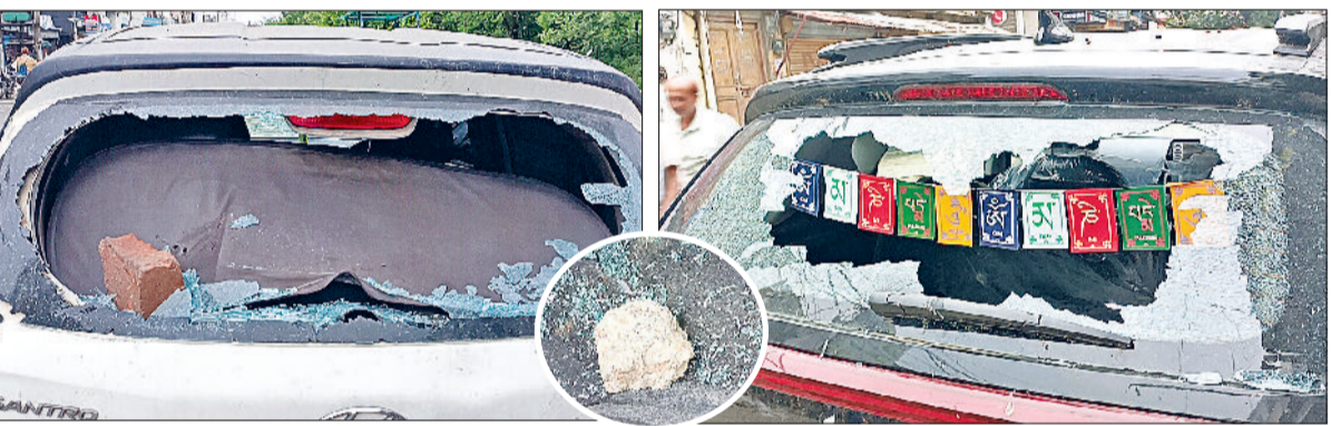
घरौंडा। बदमाशों द्वारा तोड़ी गई गाड़ियों के शीशे।

हरिभूमि न्यूज़ ▶▶ घरौंडा सोमवार तड़के शहर में एक अज्ञात युवक ने उपद्रव मचाते हुए करीब एक दर्जन गाड़ियों के शीशे पत्थर मारकर तोड़ दिए। इस घटना से वाहन मालिकों में हड़कंप मच गया। पुलिस ने शिकायत दर्ज कर जांच शुरू कर दी है। घटना सोमवार की अलसुबह लगभग 3:30 बजे की है। शहर के बीचोबीच स्थित सनातन धर्म मंदिर के समीप खड़ी दो गाड़ियों के पीछे के शीशे तोड़ने से शुरुआत हुई। इसके बाद युवक यहीं नहीं रुका, बल्कि वह लगातार शहर की