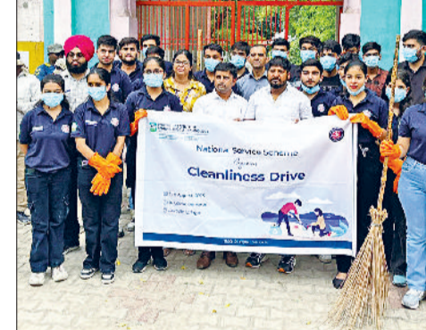
पानीपत के गांव डिकाडला में स्वच्छता अभियान चलते हुए पाइंट के स्वयंसेवी विद्यार्थी।