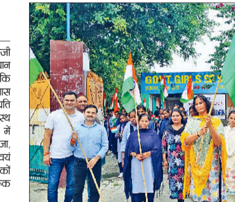
पानीपत। फैला उजियारा फाउंडेशन व राजकीय स्कूल के टीचर्स व स्टूडेंट्स तिरंगा यात्रा निकालते हुए।