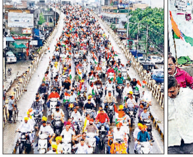
अंबाला शहर में निकली गई तिरंगा यात्रा का दृश्य।

का सैलाब नहीं डिगा बल्कि कारंवा बढ़ता गया। यात्रा आगे निरंतरता में चलेगा। इस अभियान के तहत सेंट्रल जेल के नजदीक स्थापित अमर शहीद भगत सिंह, राजगुरु, सुखदेव की प्रतिमाओं की साफ-सफाई की गई और अमर शहीदों को नमन किया गया। उन्होंने कहा कि इस यात्रा के आयोजन को लेकर पूरे देश व प्रदेश में लोग उत्साहित हैं। उन्होंने कहा कि तिरंगा हमारी आन बान और शान है। हर नागरिक व युवा में यह भावना बढनी चाहिए, मजबूत होनी चाहिए। युवाओं की संख्या से दृष्टि से देश दुनिया में अग्रणी स्थान पर हैं। भारत को विश्व गुरु बनाने की दिशा में हमें मिलकर कार्य करना है। तिरंगा यात्रा का संदेश लेकर 11 अगस्त से 14 अगस्त तक देश के हर कोने में, जिले में तिरंगा यात्राओं का